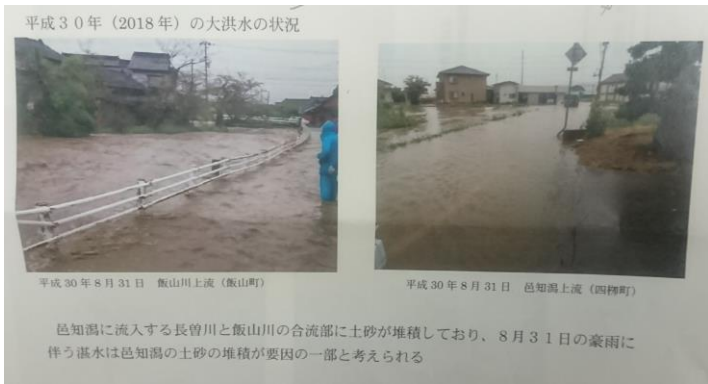
羽咋市内の豪雨被害の状況（邑知潟土地改良区資料より）