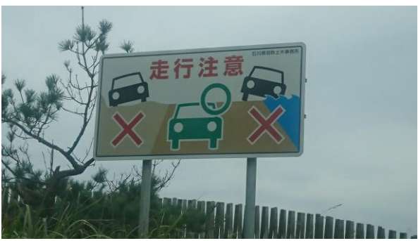
のと里山街道のICにある注意看板