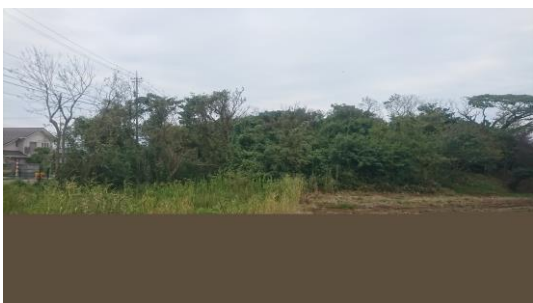
滝町の滝大塚古墳 いしかわ歴史遺産の一部に選ばれました