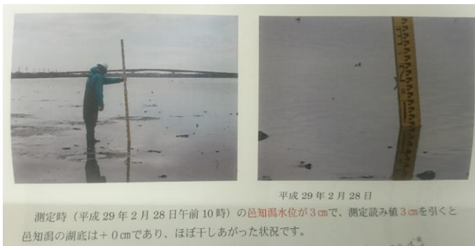
邑知潟の土砂の状況（邑知潟土地改良区資料より）