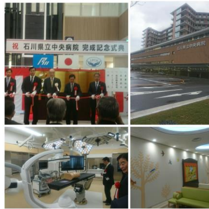
新県立中央病院の完成記念式典に参加。

以前に、この黎明だよりで紹介した「長者川の改修」について、住民から「川が増水する度に岸が削られる」という声があった部分を優先して、県や羽咋市に対応してもらいました。引き続き、川全体の改修を要望していきます。