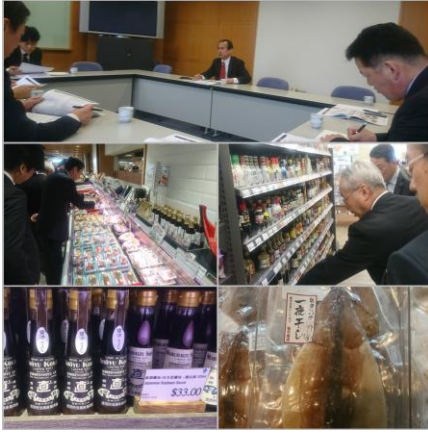
スーパーマーケットでは、石川県産醤油や能登のイカが並んでいました

私は、香港を訪れたのは初めてでしたが、日本においては判らない現地の状況や現地の人の感覚に触れることができ、貴重な経験になったと思います。