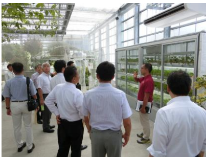
名護市の農業支援施設