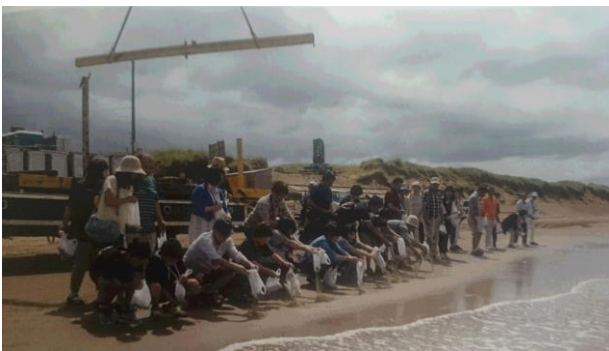
千里浜海岸を訪れた方が一人一砂運動 千里浜海岸再生について思いを共有 『千の浜守人』

千里浜海岸を訪れた方や地元の子どもたちに千里浜海岸のことをより知ってもらい、海岸再生の必要性を多くの 方に知ってもらうために、こういった取組をさらに拡大してはどうかと提案しました。