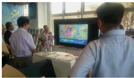
恩納村の文化情報センター