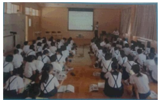
小学校の総合学習の時間で、 地元の千里浜海岸のことを学ぶ 『千里浜海岸ものしり教室』