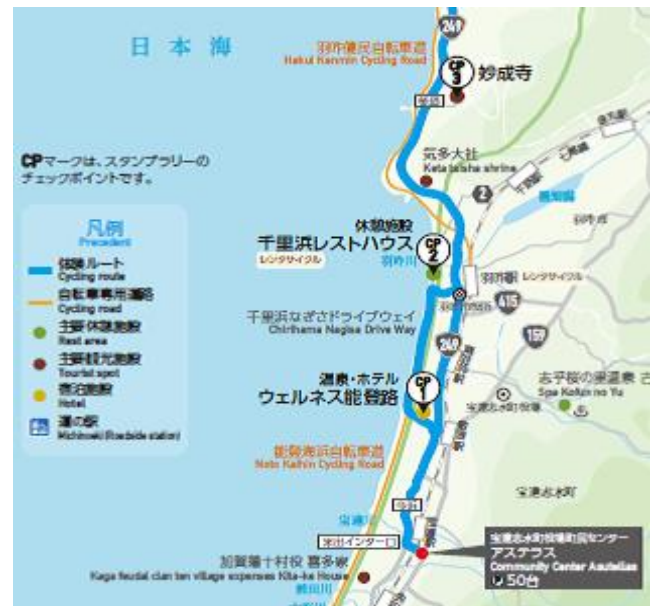
サイクリング体験コースの羽咋市・宝達志水町部分